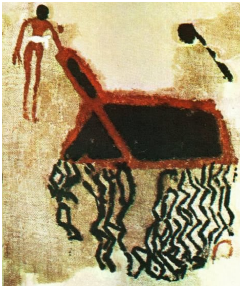
Fragmento de tela de lino con pintura. Necrópolis de Gebelein. 3500 a.c.